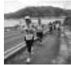
横手林道 高低差 148m